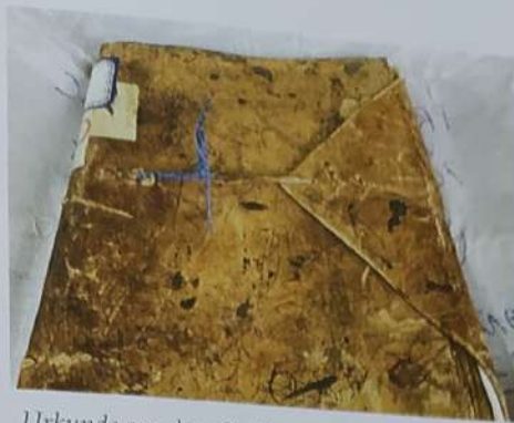
Urkunde aus dem Stadtarchiv von Cochabamba

Vermutlich war Francisca Apumayta Ende des 18. Jahrhunderts als Laienschwester Mitglied dieses Konvents. Diesem verdanken wir es, dass ihre Musik erhalten blieb, und hier scheint sie auch die Werke in unserem Programm komponiert zu haben, die sämtlich für die bereits erwähnte Doktorarbeit erforscht, kopiert und rekonstruiert wurden. Bemerkenswerterweise sind die einzigen Manuskripte, die bisher dieser Musikerfamilie zugeschrieben werden können, diejenigen von Francisca. Vielleicht trug gerade die Abgeschiedenheit des Konvents dazu bei, dass dieser einzigartige Schatz erhalten blieb: die Werke der einzigen indigenen Komponistin aus der südamerikanischen Kolonialzeit, die wir bis heute kennen. Comet Musicke versucht, die musikalische Reise der Familie Apumayta und das Beziehungsgeflecht, das diese drei Mitglieder des Anden-Adels mit der Barockmusik in