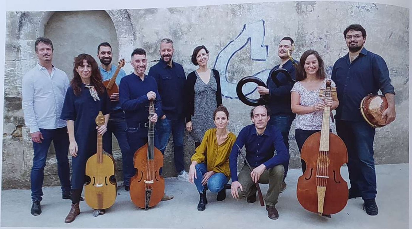
Comet Musicke

Montag, 25. Mai 2026, 11.00 Uhr (Matinee) Dominikanerkirche St. Blasius Albertus-Magnus-Platz 1